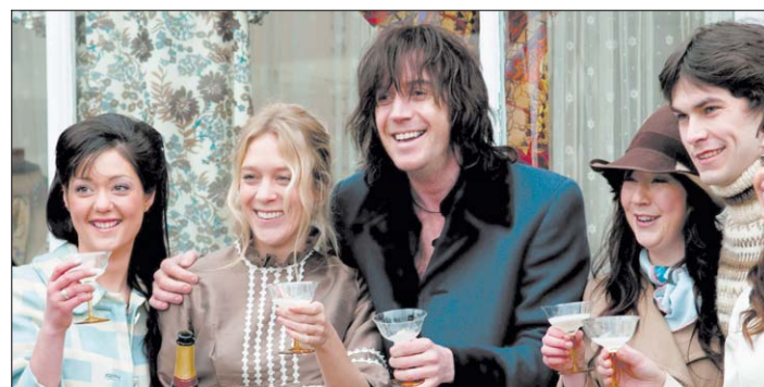
Schöne Frauen, viel Geld und schnelle Autos: Um einen berüchtigten Drogenboss geht es in dem Film „Mr. Nice“.

Er hatte 43 Decknamen, 89 Telefonanschlüsse, 25 Firmen, Kontakte zu Mafia und Geheimdiensten und über eine Million verkaufte Bücher: Kaum einer spielte mit dem Feuer des Verbrechens so ungeniert wie Howard Marks, der einst mit Hilfe der IRA und des britischen Geheimdienstes den Drogenhandel globalisierte. Er war hoch begabter Oxford-Zögling, bevor er sich zum internationalen Drogenboss, charmanter Staatsfeind und Herrscher